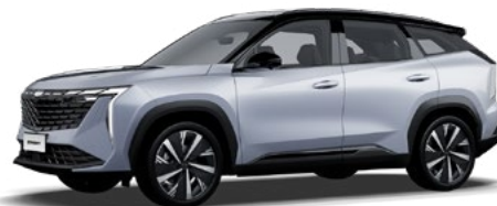
Titan Silver (сребрист) (H17)