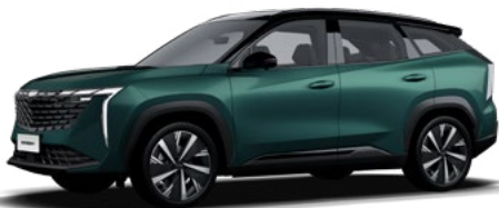
Emerald Green (зелен) (H15)