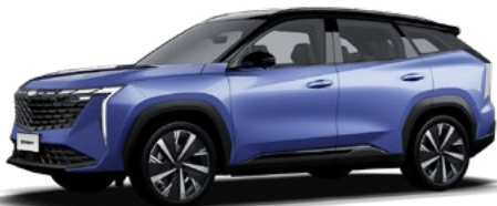
Midnight Blue (син) (H16)