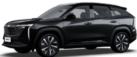
Unbounded Black (черен) (H19)